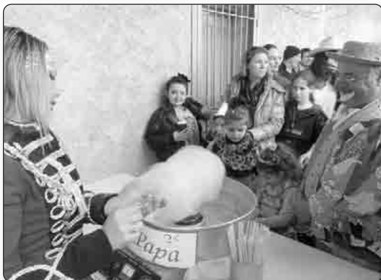
Goûter et barbe à papa pour un final gourmand