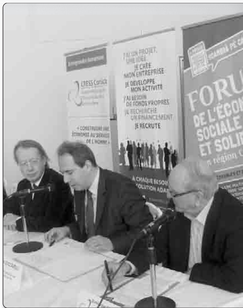
L'ADEC et la CRESS Corsica, aux commandes du forum de l'économie sociale et solidaire