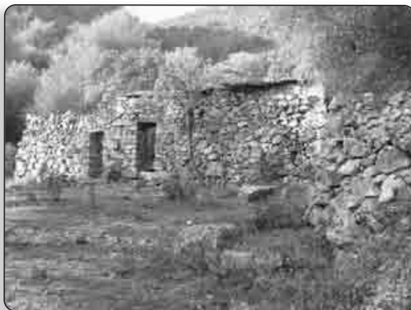
Les ruines d'U Piazzile di u Tuvarelli, au centre d'une recherche ethnographique et archéologique menée de main de maître