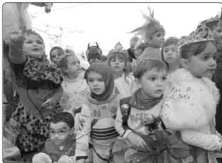
Les enfants, principaux protagonistes de la fête