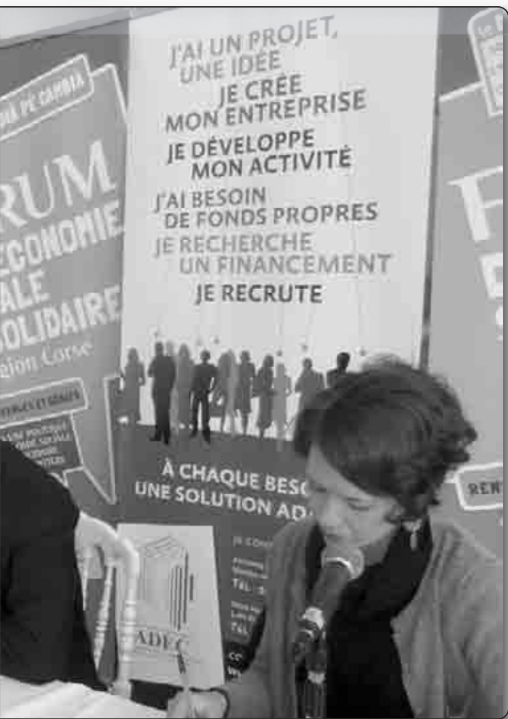
le et solidaire qui s'est tenu à Bastia le 7 mars dernier

224 en Haute-Corse et 63 en Corse du Sud). «Il nous reste des actions à mener ensemble pour que l'ESS soit à la fois pleinement reconnue et ainsi considérée comme un secteur économique à part entière, reconnaît néanmoins le conseiller exécutif. Dans ce cadre, de multiples actions peuvent être menées comme la pérennisation du dispositif «Emplois tremplins» qui permet de soutenir les structures de l'ESS dans leur projet de création d'emploi, la création de nouveaux dispositifs adaptés tels que la «Fabrique à initiatives», présentée aujourd'hui, et surtout l'intégration, de plus en plus, des clauses sociales dans la commande publique.» Un discours qui n'aura pas été pour déplaire à Thierry Jeantet (voir interview ci-après), militant de l'ESS, auteur de plusieurs livres, dont « L'Économie Sociale, une alternative au capitalisme », et invité d'honneur, en qualité de Grand Témoin , de ce 1 er forum de l'ESS à Bastia à l'occasion duquel furent remis trois prix de l'innovation sociale : à l'association MDE (Maison de l'Emploi) d'Ajaccio et du pays ajaccien, à l'association bastiaise IDF (Institut pour le Développement et la Formation) et à la SCIC Donna Corsa (voir ci-dessus).