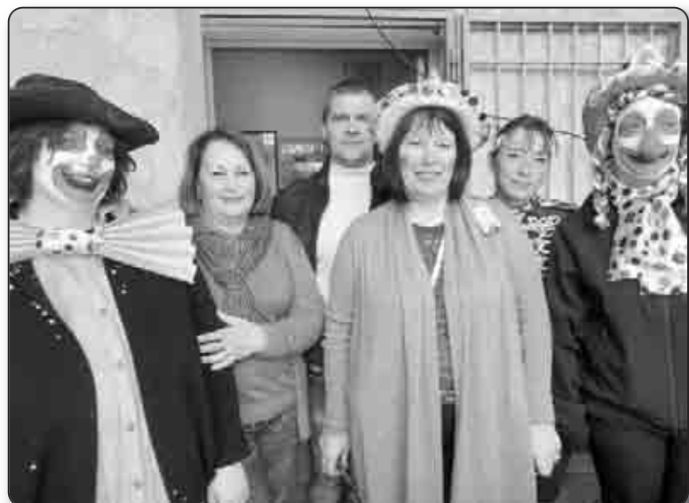
Les membres du comité des fêtes, organisateur de l'événement