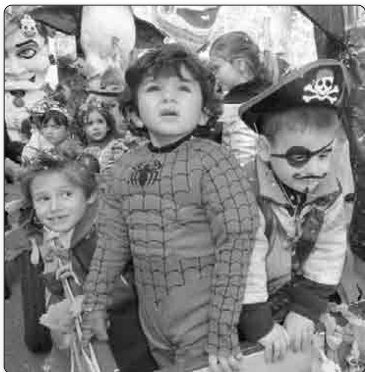
Spiderman a été un des favoris chez les garçons