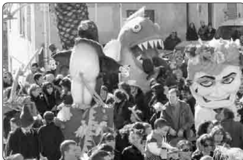
Une foule immense a participé au spectacle