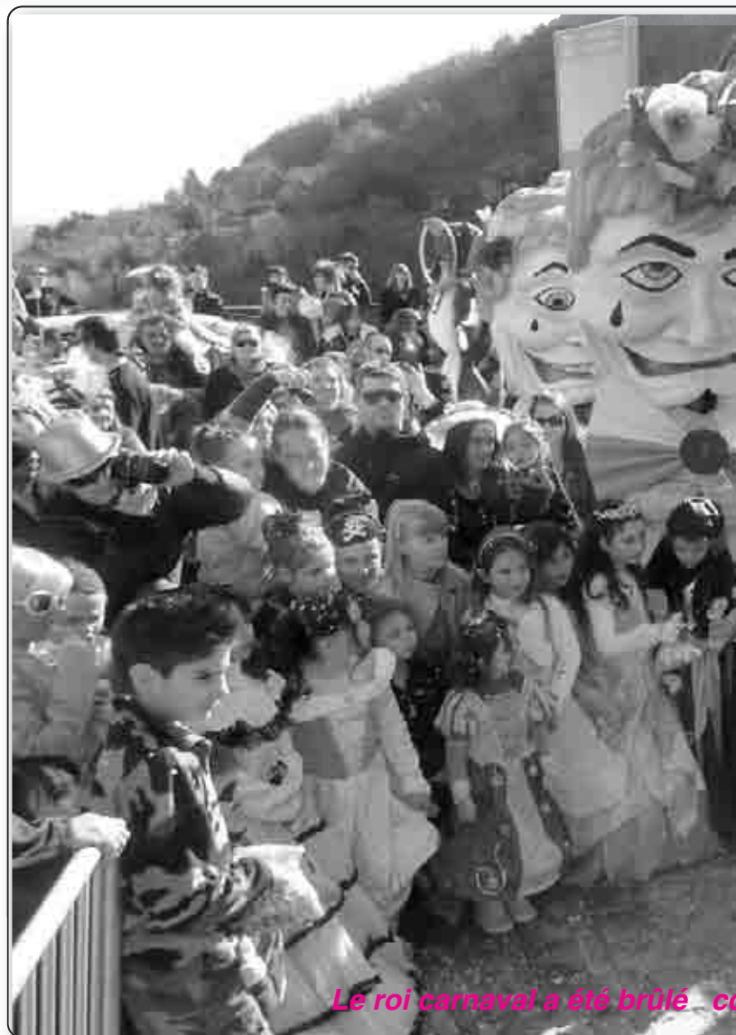
Le roi carnaval a été brûlé