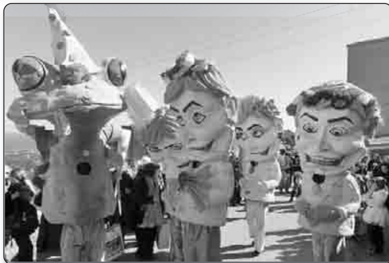
Les grosses têtes donnent l'ambiance du cortège