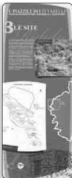
Un des panneaux de l'exposition

fruellu a dessiné structures et particularités architecturales de l'endroit et a eu le talent de reconstituer certaines scènes de la vie d'autrefois. Enfin, la couverture photographique du site et des structures a été assurée par Nicolas Mattei, Philippe Pesteil, Tumasgiu Simeoni et moi-même ». En conclusion, le chercheur tire de cette aventure une leçon : «L'émotion de départ a été vite relayée par des considérations plus froides, techniques, scientifiques, administratives, pour donner un montage interdisciplinaire susceptible de rendre compte de l'intérêt de ce domaine de recherche. Les villages délaissés étant légion, il n'est pas déplacé d'espérer que notre modeste contribution ne laisse pas indifférent le petit monde insulaire des sciences humaines et provoque d'autres analyses comparables. »